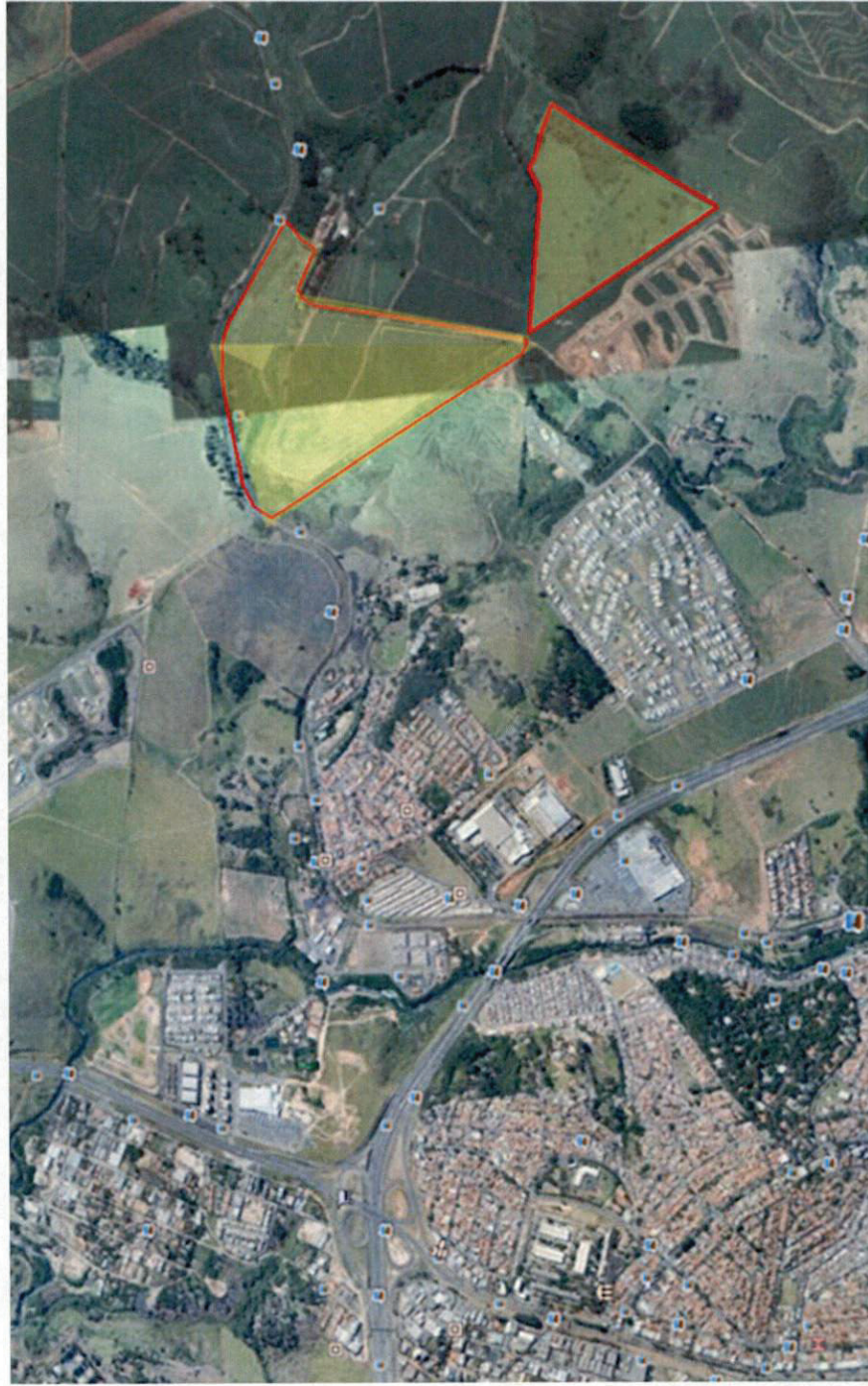
Imagem Aérea com Zoneamento Pretendido